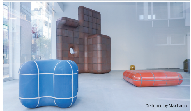
Designed by Max Lamb